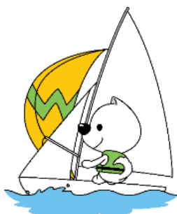
前谷 嘉志 選手 上原 慎平 選手