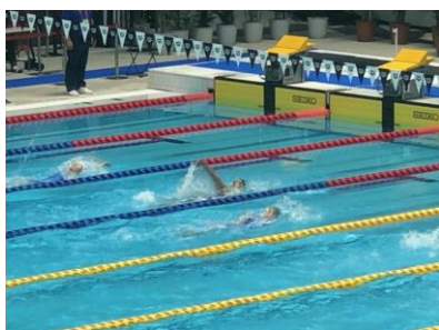
高校3年生で出場した福井国体以来、2度目の入賞です！