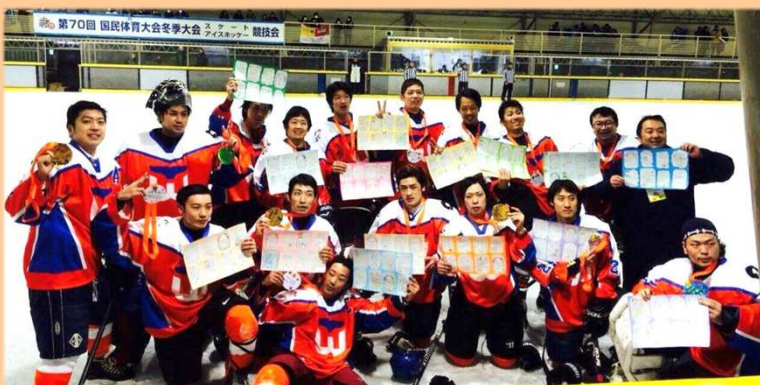
(本国体初勝利を果たしたアイスホッケー和歌山県選手団)

※スキー競技は、2月20日(金)～23日(月)群馬県利根郡片品村で開催されます。